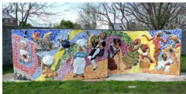
Plaza de las Llamadas