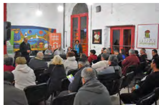
Casa de la Cultura Afrouuguayaya