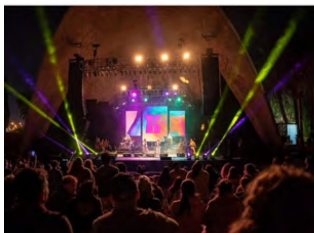
Teatro de verano