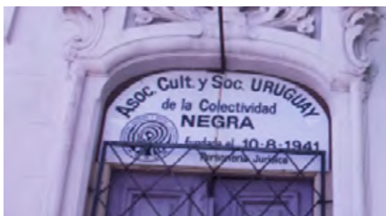
Asociación Cultural Social Uruguay Negro