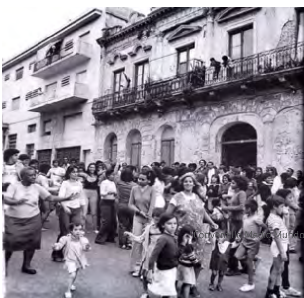
Conventillo Medio Mundo