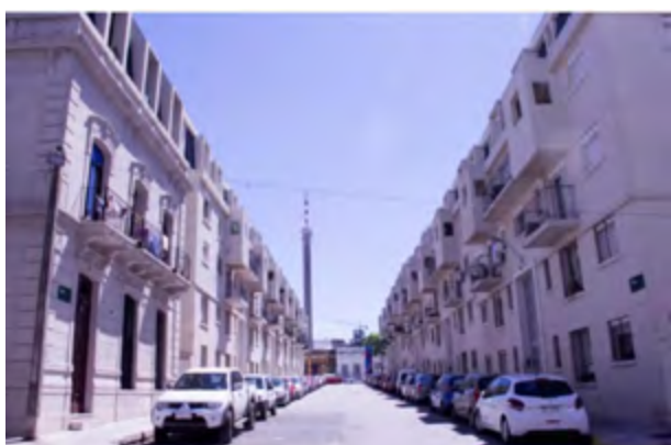
Calle Ansina hoy