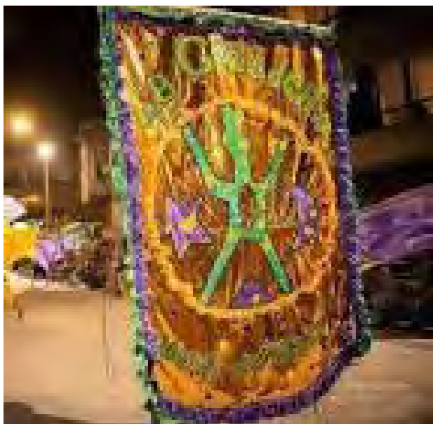
Comparsa La Gozadera