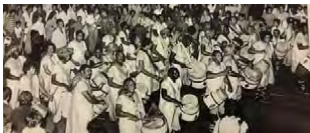
Llamada del Cordón, desfilando por Isla de Flores en Las Llamadas