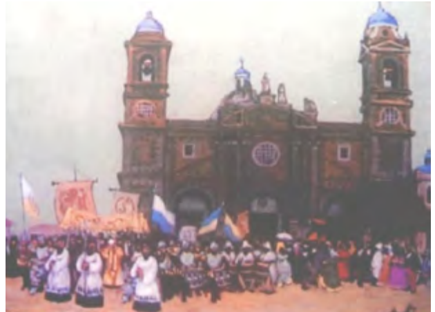
Procesión del 6 de enero, San Baltasar frente a la Iglesia Matriz. Pintura de Molinari

La Plaza Matriz fue el lugar donde, desde el año 1770 al menos, se congregaban las diferentes naciones africanas que veneraban a San Benito y San Baltasar cada 6 de enero. Las naciones más numerosas, Congos y Banguelas, eran las que encabezaban tales procesiones y celebraciones. Esos encuentros de africanos fueron fundamentales para que, poco a poco, fuera surgiendo un sonido cada vez más homogéneo, que sintetizó diferentes ritmos y aunó instrumentos de unas y otras naciones. En las procesiones se homenajeaba a San Baltasar y San Benito no solamente con toque de instrumentos sino también con canto y danza.