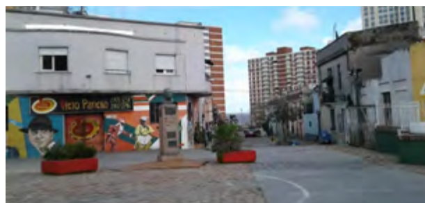
Peatonal del Candombe