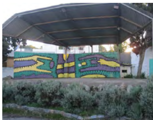
Teatro Alfredo Moreno