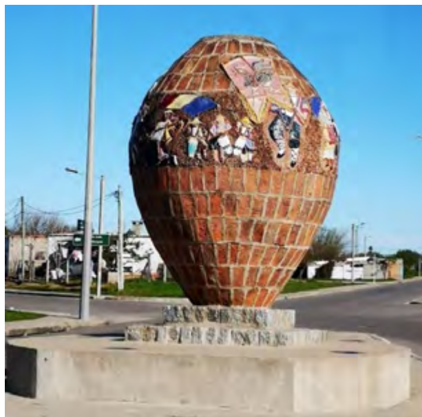
Monumento al Tambor

En el mismo espacio se ha construido la Plaza de las Llamadas donde se deja constancia de las comparsas ganadoras en Durazno, acompañado de imágenes candomberas realizadas en relieve.