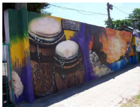
Teatro Alfredo Moreno