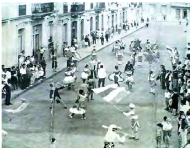
Comparsa desfila por la calle Ansina, década de 1950