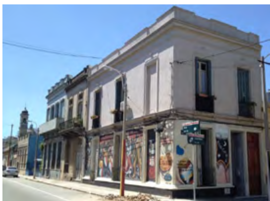
Sede Social de Africanía

Africanía es la organización del investigador afrouruguayo Tomás Olivera Chirimini, quien además dirige la agrupación de candombe, Bantú. En esta institución se realizan ciclos de charlas, talleres de tambores de candombe y ensayos de agrupaciones teatrales. Bantú ha participado en el Concurso Oficial del Teatro de Verano y viajado al extranjero difundiendo el candombe. En su sede se han realizado diversos eventos y se han grabado candombes.