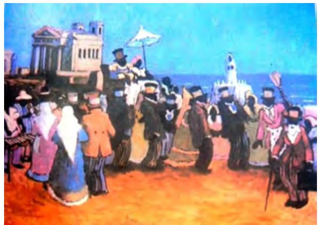
Candombe en “las canchitas” del sur. Pintura de Molinari

Cabindas, Molembos, y en fin, todos los de Angola hacían allí su rueda, y al son de la Bambora, del tamboril, de la marimba, el mate o porongo, de la mazacalla y de los palillos, se entregaban contentos al candombe con su calunga, cangué... eee llumbá, eee, llumbá, y otros cánticos, acompañados con las palmas cadenciosas de los danzantes, que movían piernas, brazos y cabeza al compás de aquel concierto que daba gusto a los tíos”. La celebración se prolongaba hasta la puesta del sol.