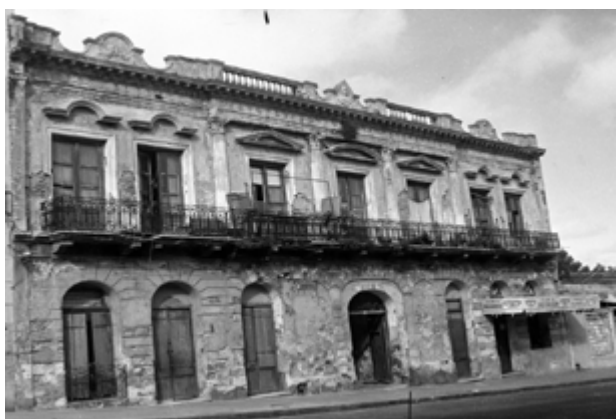
Conventillo Medio Mundo