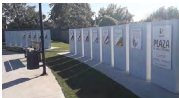
Plaza de las Llamadas