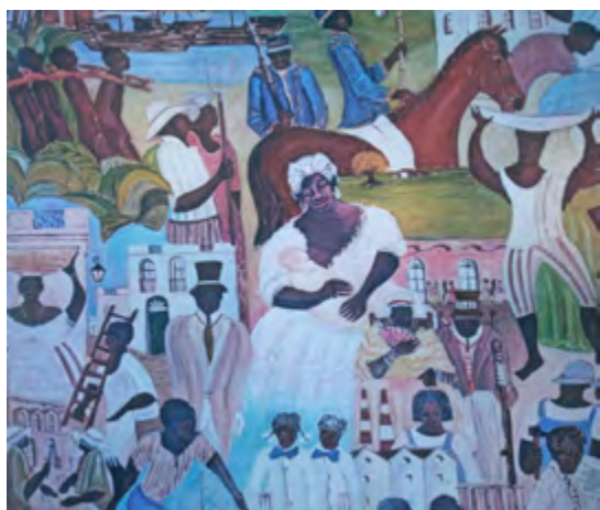
Mural realizado por Rubén Darío Galloza en la sala principal de Acsun