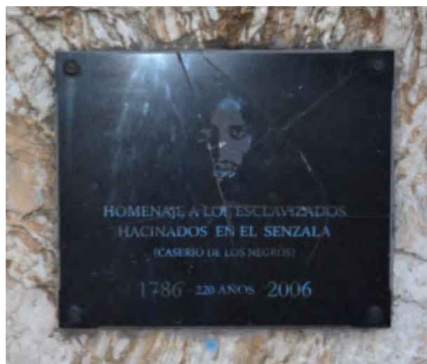
Placa de la Plaza Sensala

En un principio se pensó que la construcción principal del Caserío de la Compañía de Filipinas se había realizado en el predio que hoy ocupa la Planta de Alcoholes de Ancap, pero estudios arqueológicos más recientes han ubicado restos de la construcción del Caserío en el terreno que ocupa la Escuela Capurro entre Av. Capurro y Juan María Gutiérrez, muy cercano al Parque Capurro. En 2005 se inauguró la Plaza Sensala, ubicada entre los pasajes: Rossi, Solís Grande y Denis. En el centro de la plaza hay un monolito que homenajea el Caserío de las Filipinas, también llamado Caserío de los Negros. Actualmente hay una Comisión que continúa con las investigaciones, nucleando varias instituciones y la sociedad civil.