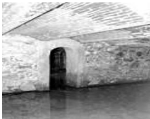
Imágenes de espacios que pudieron formar parte de la construcción que se llamó Caserío de los Negros