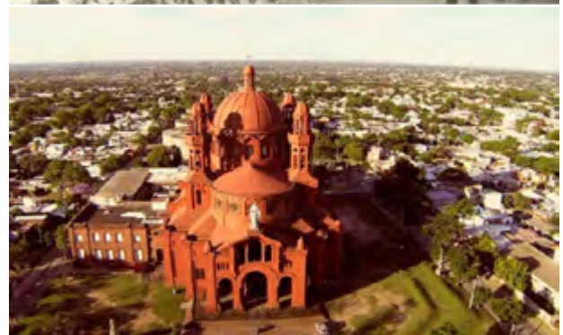
Cerrito de la Victoria