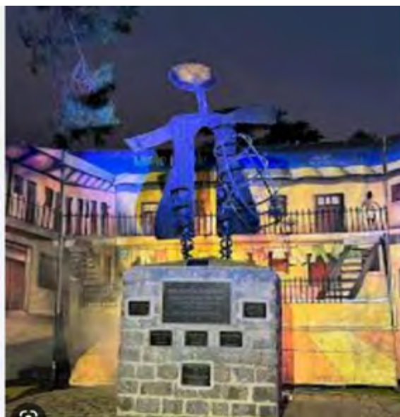
Sede de la comparsa La Generación Lubola