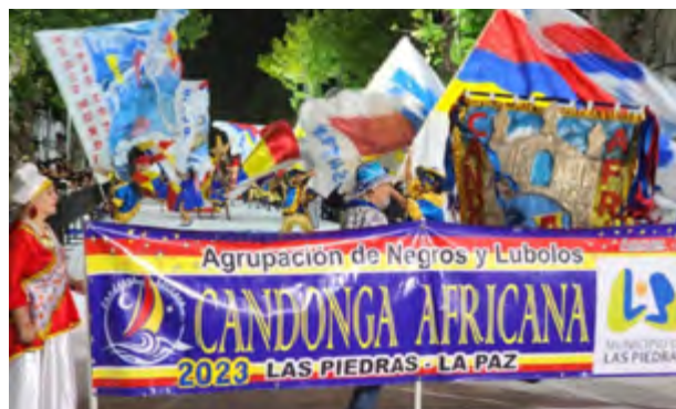
Comparsa Candonga Africana