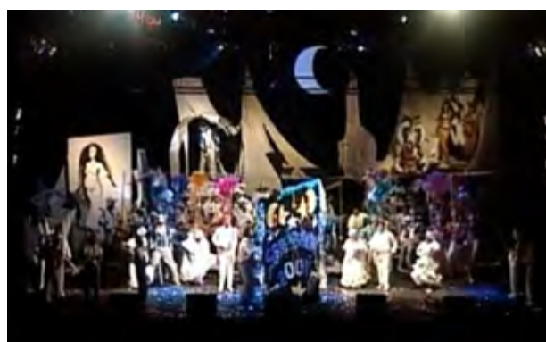
Teatro de verano

En este teatro se presentan los diferentes espectáculos oficiales de carnaval: el Concurso Oficial, el Carnaval de Las Promesas, la Final de Murga Joven, y la Prueba de Admisión. Las distintas categorías presentan sus propuestas ante miles de personas que noche a noche concurren. Las comparsas de candombe año a año realizan composiciones inéditas para sus actuaciones.