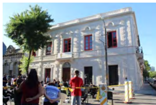
Casa de la Cultura Afrouuguayaya

Allí se llevan adelante talleres de candombe, toque de tambores y danza; exposiciones de arte afro; presentaciones de libros; y actuación de solistas y agrupaciones de candombe.