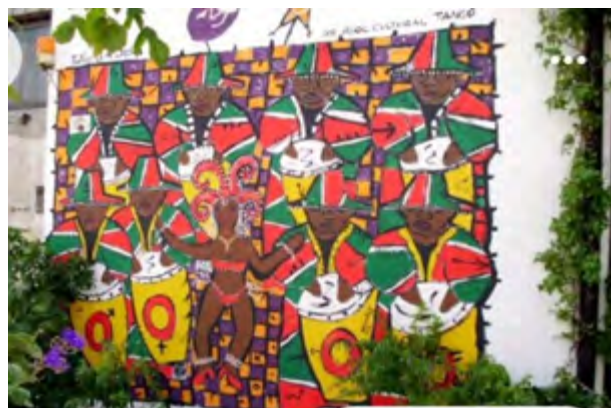
Peatonal del Candombe